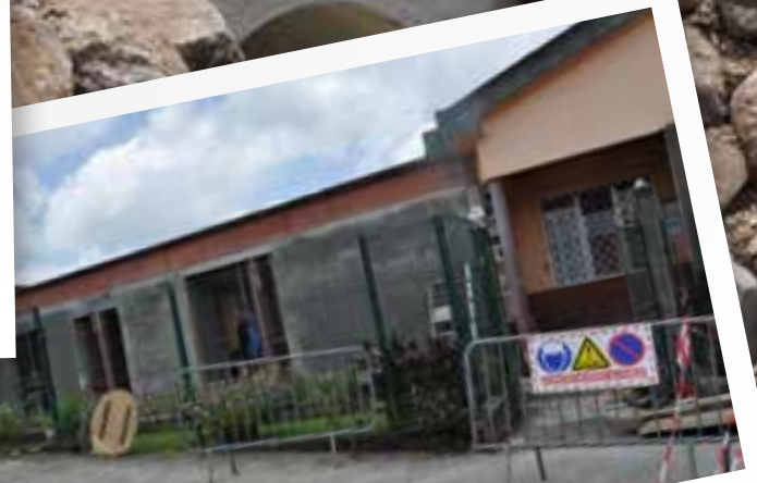
EXTENSION ETAT CIVIL