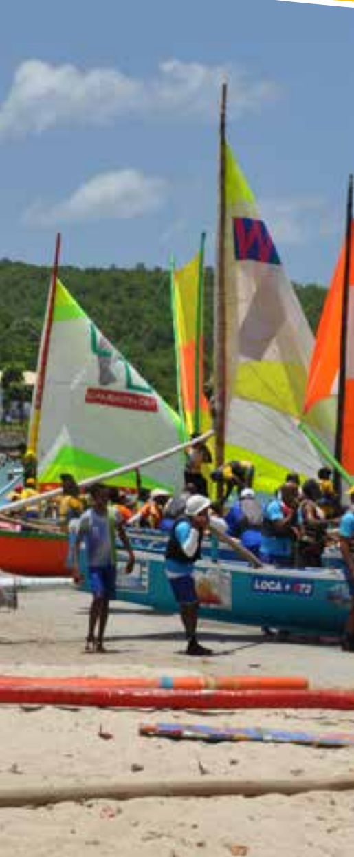
TERRE DE PATRIMOINE