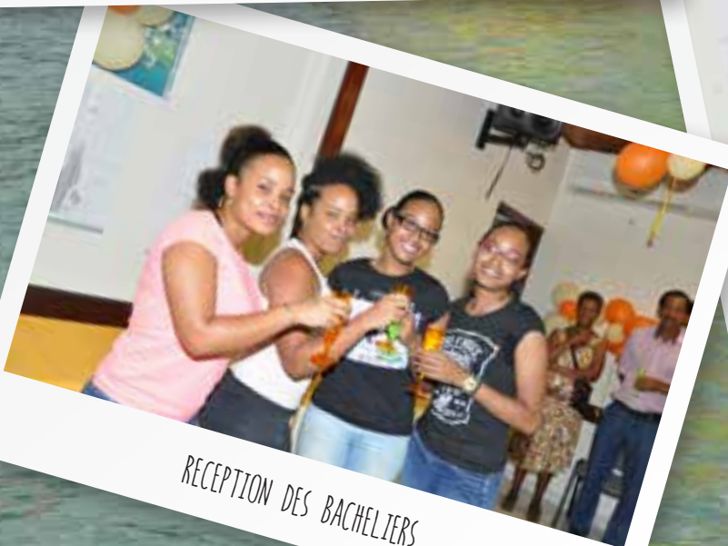
RECEPTION DES BACHELIERS