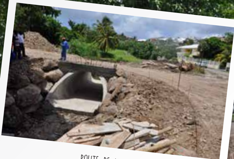
ROUTE DE XAVIER