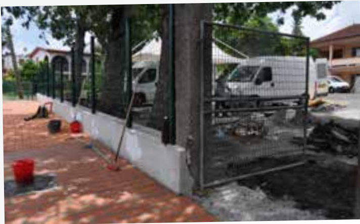
TRAVAUX ECOLE ILET CHARLES