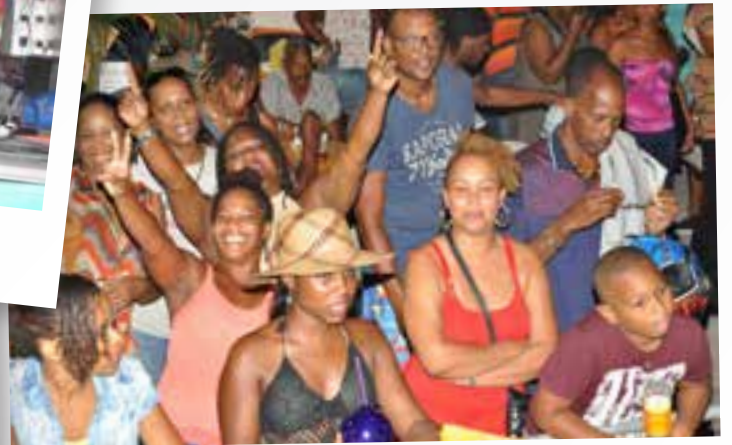
FETE DE L'ANSE MITAN