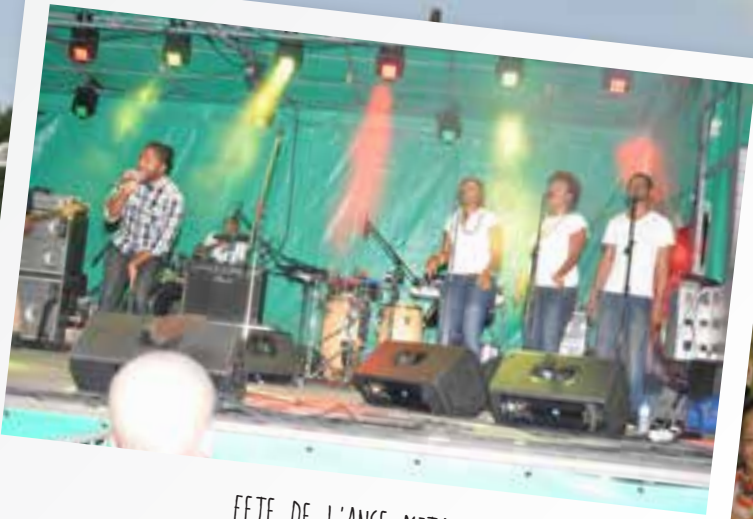
FETE DE L'ANSE MITAN