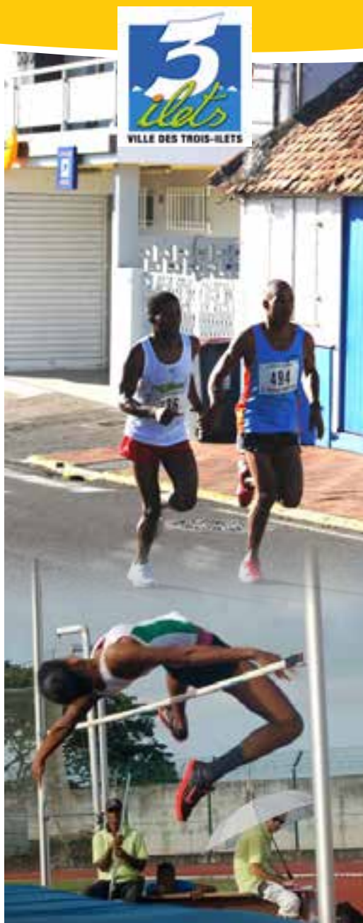
TERRE DE SPORT