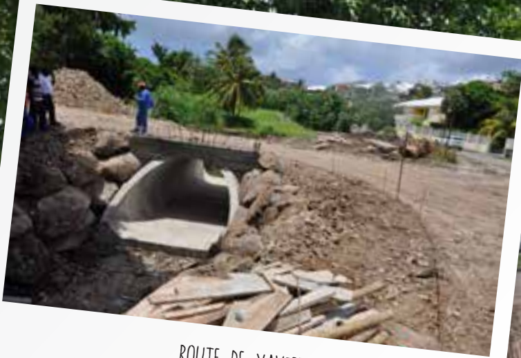
ROUTE DE XAVIER