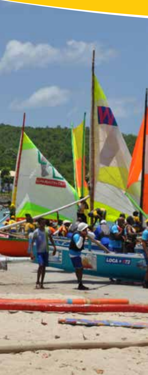
TERRE DE PATRIMOINE