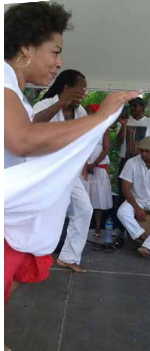
TERRE DE CULTURE