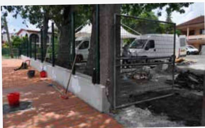
TRAVAUX ECOLE ILET CHARLES