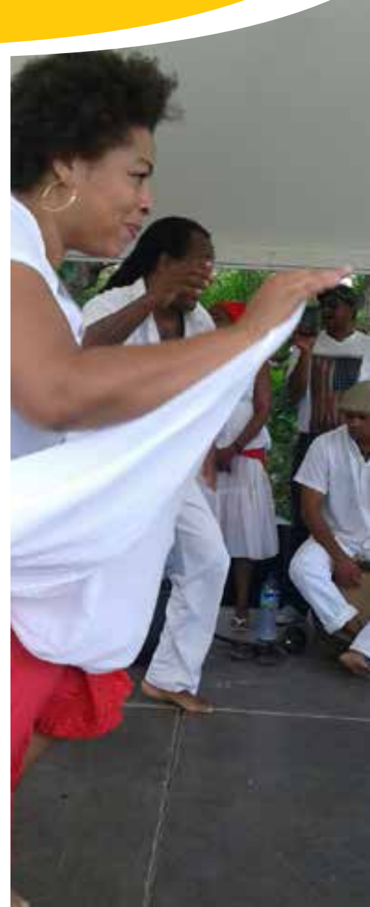
TERRE DE CULTURE