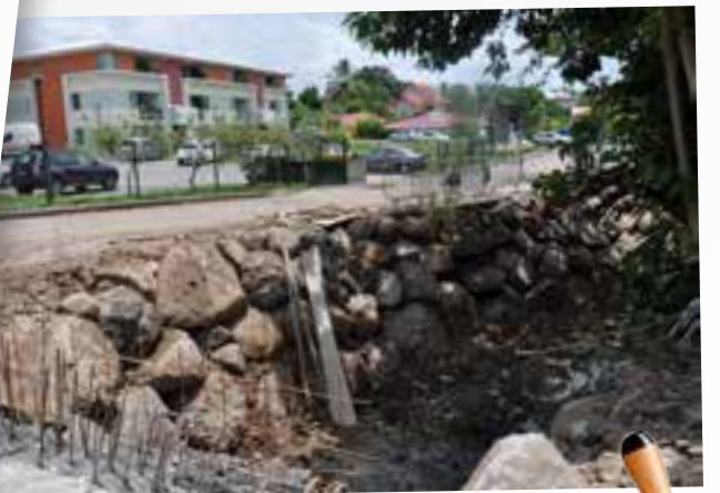
ROUTE DE XAVIER