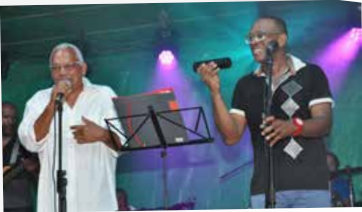
FETE DE L'ANSE A L'ANE