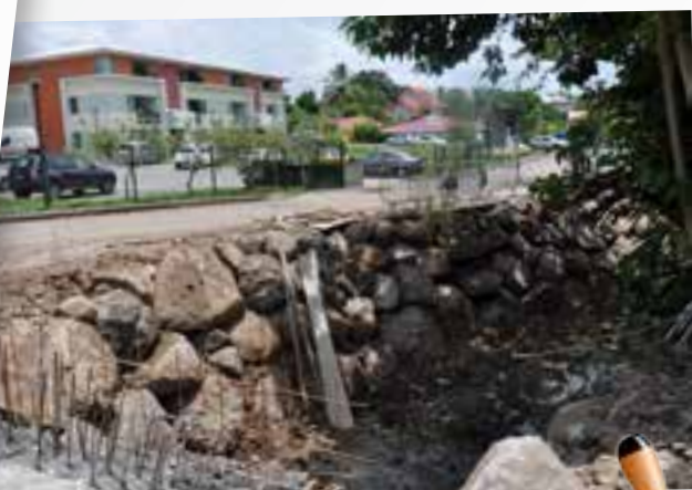
ROUTE DE XAVIER