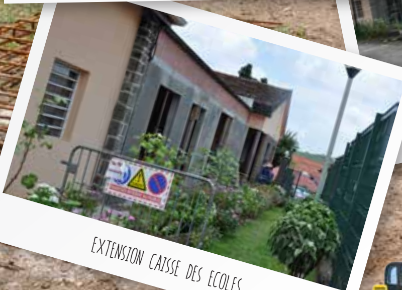
EXTENSION CAISSE DES ECOLES