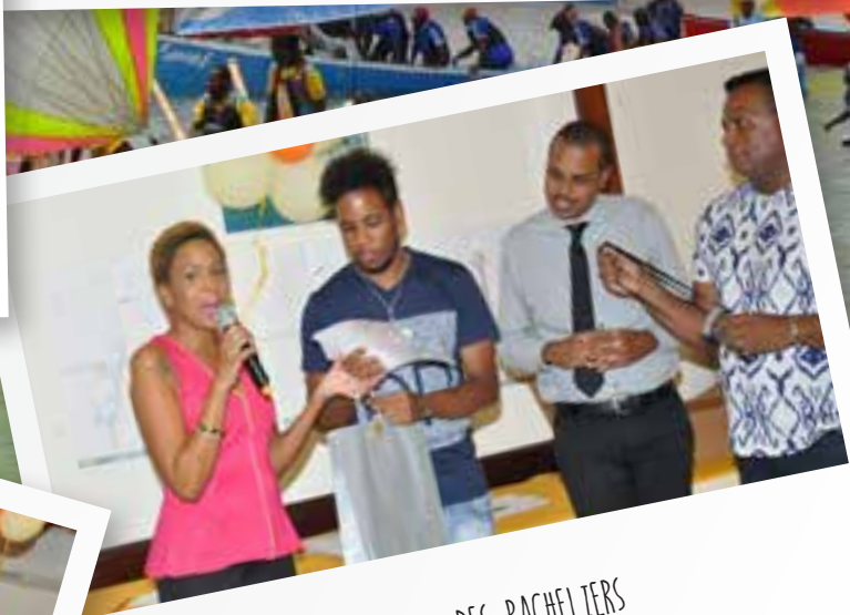
RECEPTION DES BACHELIERS